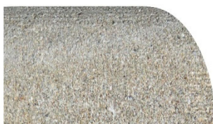
A) Lavorazione a becco di civetta + 15 €/ml