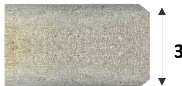
B) Lavorazione a costa retta