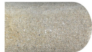
C) Lavorazione a costa toro + 24 €/ml